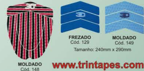
MOLDADO Cód. 148 Tamanho: 330 x 280mm FREZADO Cód. 106 Tamanho 300 x 280mm FREZADO Cód. 105 Tamanho 330 x 290mm FREZADO Cód. 107 Tamanho 310 x 280mm FREZADO Cód. 129 Tamanho: 240mm x 290mm MOLDADO Cód. 149 Tamanho: 240mm x 290mm

www.trintapes.com (27) 3252 0111 - 9971 8951 - 97*35081