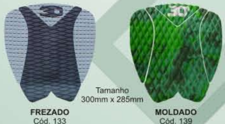
Tamanho 300mm x 285mm FREZADO Cód. 133 MOLDADO Cód. 139