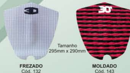
Tamanho 295mm x 290mm FREZADO Cód. 132 MOLDADO Cód. 143