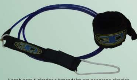
Leash com 1 girador e braçadeira em neoprene simples

Giradores especiais desenvolvidos especialmente para cordas de surf. Tecnologia TRINTAPES.