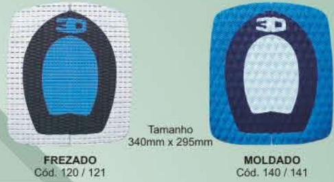
Tamanho 340mm x 295mm FREZADO Cód. 120 / 121 MOLDADO Cód. 140 / 141