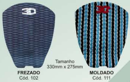
Tamanho 330mm x 275mm FREZADO Cód. 102 MOLDADO Cód. 111