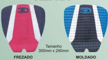
Tamanho 300mm x 290mm FREZADO Cód. 119 MOLDADO Cód. 137