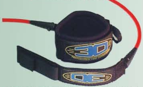
Leash com 2 giradores e braçadeira em neoprene duplo