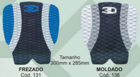
Tamanho 300mm x 285mm FREZADO Cód. 131 MOLDADO Cód. 138