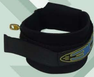
Braçadeira em neoprene