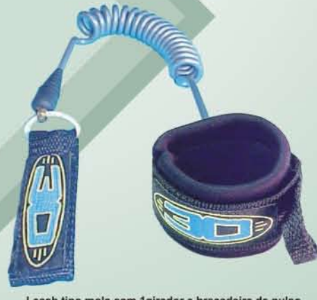
Leash tipo mola com 1 girador e braçadeira de pulso