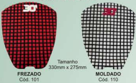
Tamanho 330mm x 275mm FREZADO Cód. 101 MOLDADO Cód. 110