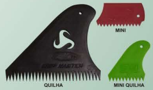
QUILHA MINI QUILHA