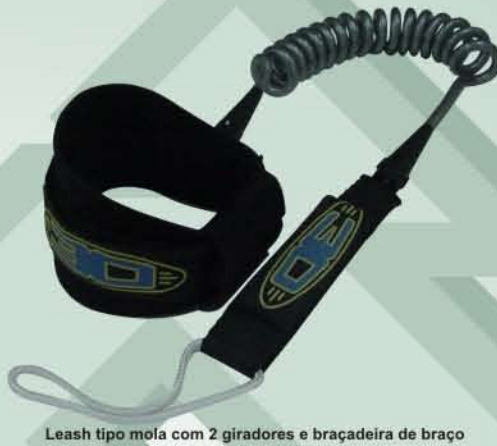
Leash tipo mola com 2 giradores e braçadeira de braço