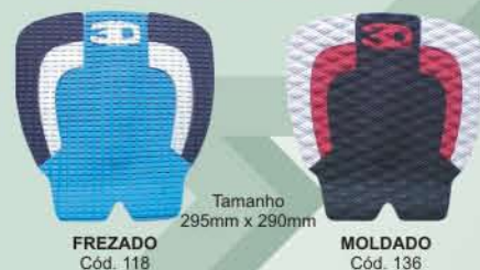
Tamanho 295mm x 290mm FREZADO Cód. 118 MOLDADO Cód. 136