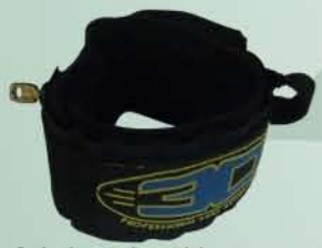
Leash com 2 giradores e braçadeira em neoprene simples