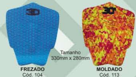
Tamanho 330mm x 280mm FREZADO Cód. 104 MOLDADO Cód. 113