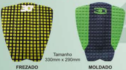
Tamanho 330mm x 290mm FREZADO Cód. 100 MOLDADO Cód. 109