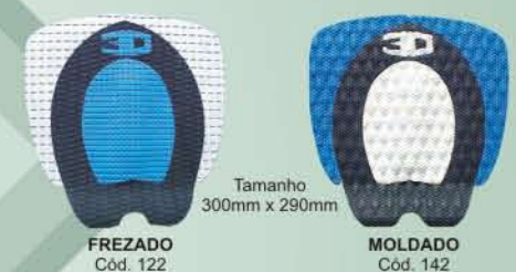
Tamanho 300mm x 290mm FREZADO Cód. 122 MOLDADO Cód. 142