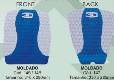
MOLDADO Cód. 145 / 146 Tamanho: 340 x 290mm MOLDADO Cód. 147 Tamanho: 330 x 285mm