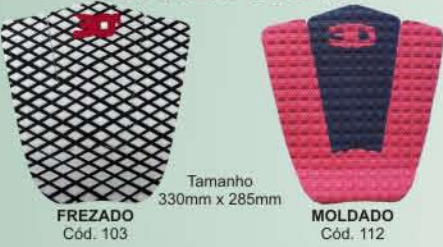
Tamanho 330mm x 285mm FREZADO Cód. 103 MOLDADO Cód. 112