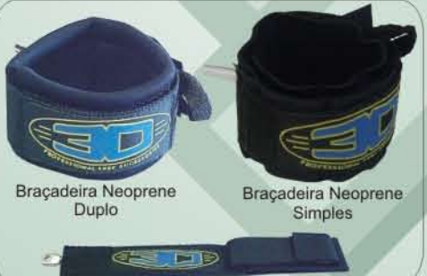
Braçadeira Neoprene Duplo Braçadeira Neoprene Simples

Sistema de girador montado diretamente sobre a corda de poliuretano.