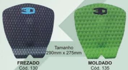
Tamanho 290mm x 275mm FREZADO Cód. 130 MOLDADO Cód. 135