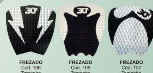
FREZADO Cód. 106 Tamanho 300 x 280mm FREZADO Cód. 105 Tamanho 330 x 290mm FREZADO Cód. 107 Tamanho 310 x 280mm